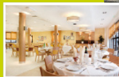
«La Chartreuse» Résidence Médicalisée EHPAD Commune de Coutras / Gironde (33)