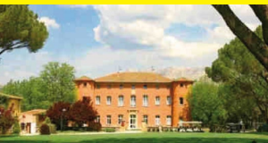
Hôtel Château l'Arc- Fuveau Aix en Provence

Economiques et conviviales, les résidences de centre-ville Odalys City offrent une vraie alternative à l'hôtel. Conçus aussi bien pour la clientèle affaires (en semaine) que familiale (le week-end), les appartements sont tous équipés d'une kitchenette (linge de lit fourni et TV gratuite) et bénéficient d'une décoration contemporaine. Lits faits à l'arrivée et ménage quotidien sur certains sites. Possibilité de séjourner à la nuitée.