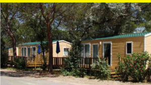
Domaine Vitalys Elysée - Le Grau du Roi

En France (Aix en Provence, Cauterets, Les Baux de Provence, Argelès, Grasse...) ou à l'étranger, en formule club ou en formule traditionnelle, les hôtels 3 et 4* Odalys proposent des séjours détente (espace balnéothérapie sur certains sites) en formule petit déjeuner ou demipension.