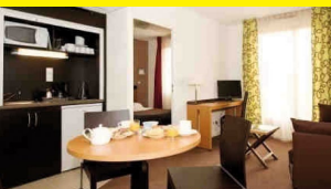
Résidence Odalys City Bioparc - Lyon

Implantées dans des demeures historiques réhabilitées, les résidences Castelys abritent 34 appartements de standing dans un environnement protégé. La première réalisation a ouvert ses portes en juin 2009 à Erdeven, dans le Morbihan. Plusieurs autres projets sont actuellement en cours dans le département dont un sur la commune de Hennebont (GolfeduMorbihan).