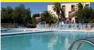
Résidence-club L'Île d'Or La Londe les Maures

Bénéficiant d'un emplacement privilégié (dans un parc, au milieu d'un golf, au pied des pistes de ski...) et d'une décoration soignée et de grand confort, les résidences prestige Odalys incluent également de nombreuses prestations comme linge de lit, la télévision gratuite et la présence à la montagne et la campagne d'une piscine couverte chauffée, d'un sauna ou hammam et d'une salle de fitness.