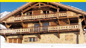
Chalet Alpanorama - L'Alpe d'Huez

Filiale d'Odalys, Vitalys propose des vacances à vivre en toute liberté dans des domaines résidentiels de plein air composés de mobil-homes entièrement équipés. Situés à la mer et à la campagne au coeur de grands parcs arborés, les sites Vitalys offrent en juillet et août toutes les prestations d'une résidence-club : animations enfants et ados en journée et en soirée, et nombreuses infrastructures sportives.