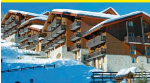
Résidence Les Brigues - Courchevel 1550

■ Odalys Vacances se distingue de ses concurrents par la disparité des formes d'hébergement proposées, allant des résidences de plein air Vitalys (mobil-homes) aux chalets et villas de standing en passant par les résidences, les résidences clubs, les résidences de prestige, les résidences de centre ville Odalys City, les maisons en bois, les hôtels et les résidences Castelys situées dans des bâtiments classés.