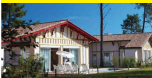
Résidence Prestige Le Clos Bonaventure - Gassin

Situées à la mer, à la montagne ou à la campagne, les résidences Odalys offrent une qualité d'accueil irréprochable et de nombreux services : linge de lit inclus pour la plupart des sites, piscine extérieure, location de kit bébé, location de télévision, laverie, accès Internet (payant) et parking gratuit. Une piscine couverte et chauffée est également proposée sur de nombreuses résidences situées à la montagne et à la campagne.