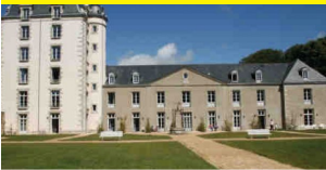
Résidence Castelys Le Château de Keravéon - Erdeven